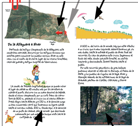
Foto en 3D con la ruta a seguir

Salida Perfil aproximado de la ruta con desniveles